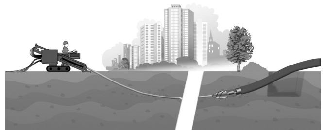
Протяжка трубы с защитным слоем методом ГНБ